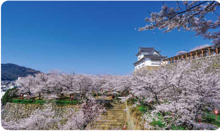
津山市 / Tsuyama city

人口約10万人で、暮らしに必要なまちの基盤が充実。保育園(所)・幼稚園・認定こども園から高校・高専・大学まで各種教育・保育・医療施設が整い、のびのび安心して子育てが可能。仕事は5000を超える事業所があり、特に製造業は全国有数の技術力を持つ金属・機械産業、木工加工が有名。