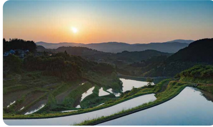
久米南町 / Kumenan town

令和元年度合計特殊出生率2.88の全国有数の子育て支援のまち。出産前から大学卒業までの切れ目ない子育て支援が自慢です。また、奈義町現代美術館をはじめとする文化と、国定公園那岐山が代表する自然にあふれ、自然と文化が豊かな町です。新型コロナウイルス感染症対策においても町独自の緊急地域経済対策給付金を全町民へ配布しているナギフカードへ自動チャージするなど、迅速な対応を行いました。