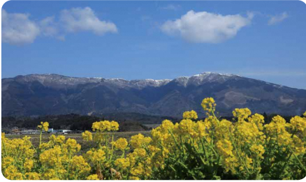
奈義町 / Nagi town

人口約1万1000人の小さい町だが、西日本有数の規模を誇る「勝央工業団地」があります。高速道路も近く、光回線や上下水道網など生活インフラも整備されている。北部地域ではブドウやモモなどの果物栽培も盛んで、新規就農を機に移住する人も多い。まさに「ほどよい!」田舎町です。