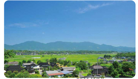
勝央町 / Shoo town

美しい水資源に恵まれた鏡野町は鳥取県との県境に位置しています。そよ風と樹木が観られる高原、滝の裏側から流れ落ちる清水が楽しめる滝、美しい景色が広がる湖、美人の湯として名高い温泉、トマトやいちご、ピオーネを始めとした農産物など身体がやわらかい空気で満たされる自然豊かな小さな里山です。