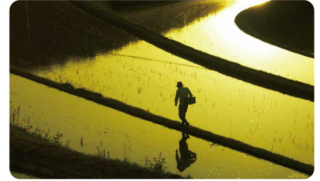
美咲町 / Misaki town

日本棚田百選に認定された2か所の棚田を有し、昔ながらの田舎風景が広がる農業が盛んなまち。農業体験など自然や人とのつながりを大切にする情操教育を推進するとともに、出産祝い金や入学・卒業祝い金、18歳までの医療費が無料など、子育て支援策が充実。家賃補助などの補助制度あり。