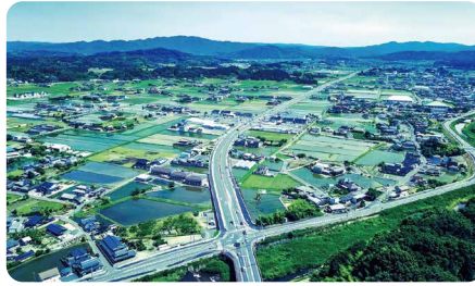
鏡野町 / Kagamino town

人口約10万人で、暮らしに必要なまちの基盤が充実。保育園(所)・幼稚園・認定こども園から高校・高専・大学まで各種教育・保育・医療施設が整い、のびのび安心して子育てが可能。仕事は5000を超える事業所があり、特に製造業は全国有数の技術力を持つ金属・機械産業、木工加工が有名。